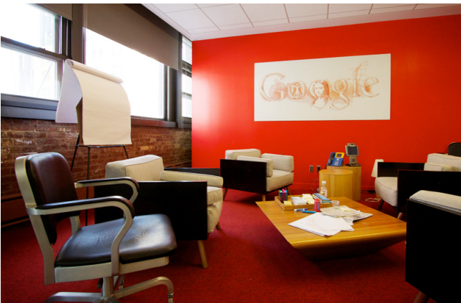
Sala de reuniones de Google.

Está demostrado que crear ambientes que permitan “desconectar” al trabajador dentro del propio centro, establecer programas de formación disruptiva y alentar los intereses personales de éstos es una forma de promover su creatividad en el trabajo y, por tanto, su productividad e implicación en el mismo. Con esta actividad pretendemos provocar ese espíritu de curiosidad, autocrítica y superación creativa a vuestro centro de estudios.