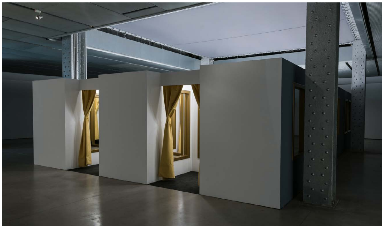
Changing Rooms en Espacio Fundación Telefónica.

Las dos instalaciones expuestas en Certezas efímeras invitan a reflexionar en torno a la idea de cambio constante. El artista nos envuelve en un laberinto conceptual en el que toda certeza se descubre efímera y nos hace evocar la necesidad de permanencia pero también y, sobre todo, la volatilidad a la que está sujeta la realidad que creemos incuestionable.