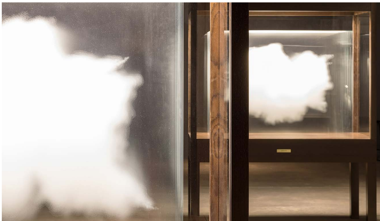
Detalle de Nido de las nubes

A través de esta pieza, Erlich nos sugiere un reencuentro nostálgico con nuestra infancia al hacernos creer que es posible acercarse y tocar las nubes. Según el propio artista, “los niños miran al cielo e imaginan que las nubes tienen peso y textura, que las podrían atrapar con las manos”. Cuando traspasamos esta primera impresión nos percatamos de la presencia de formas concretas y reconocibles en esas nubes: países de la Unión Europea, Bélgica, Italia, Reino Unido, Francia, Luxemburgo, Alemania y España. Aquí el artista nos recuerda la inestabilidad de lo que consideramos fijo y eterno utilizando dos ideas que, en apariencia, no tienen relación: el mapa y la nube.