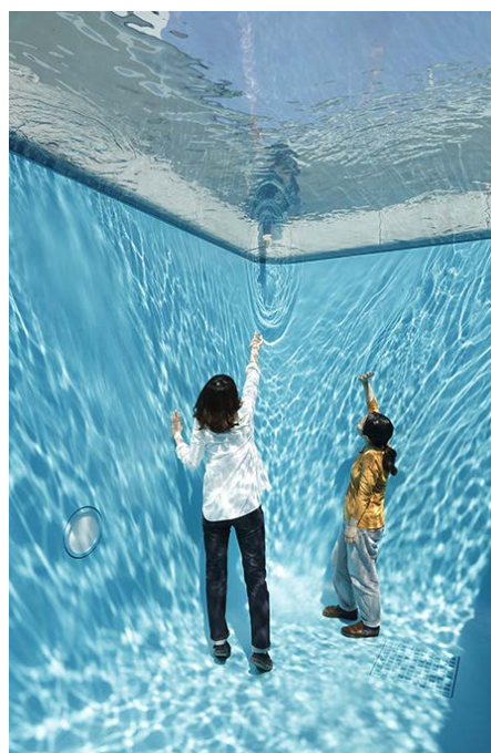
Swimming pool , 1999, 21 st Century Museum of Contemporary Art de Kazanawa

En 1999 creó la instalación Swimming pool . Se trata de una piscina que cuando se ve desde la parte superior, parece estar llena de agua. Sin embargo, es sólo una fina capa de agua sobre un vidrio transparente que permanece en movimiento para dar mayor veracidad. Por debajo, un espacio vacío con paredes de color aguamarina donde los visitantes pueden entrar.