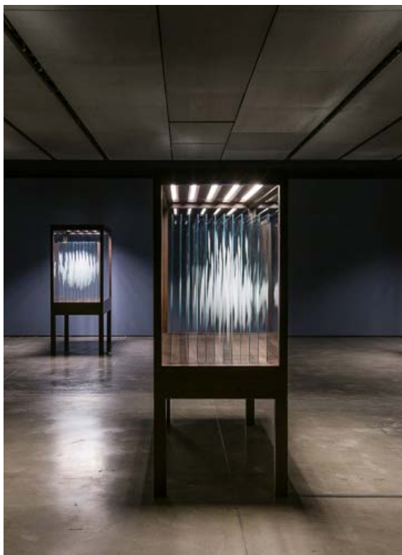
El "truco" de Nido de las nubes desvelado

Las piezas que componen Certezas Efímeras , como tantas otras del artista, juegan con perspectivas imposibles que desarticulan nuestro sentido de la orientación y obligan a cuestionarse lo evidente o lo que creemos certero. De este modo, mediante el uso de ilusiones ópticas, espejismos o elementos escenográficos, Erlich juega con la realidad, la manipula sutil pero eficazmente, con el fin de crear una tensión perceptible entre lo real y lo irreal, lo posible y lo imposible, un desencuentro entre el objeto percibido y el sujeto que percibe. Estas paradojas visuales nos hacen dudar de nuestro propio entorno, obligándonos a reflexionar sobre lo frágiles que son las primeras impresiones y las certezas que asumimos como verdades inmutables.