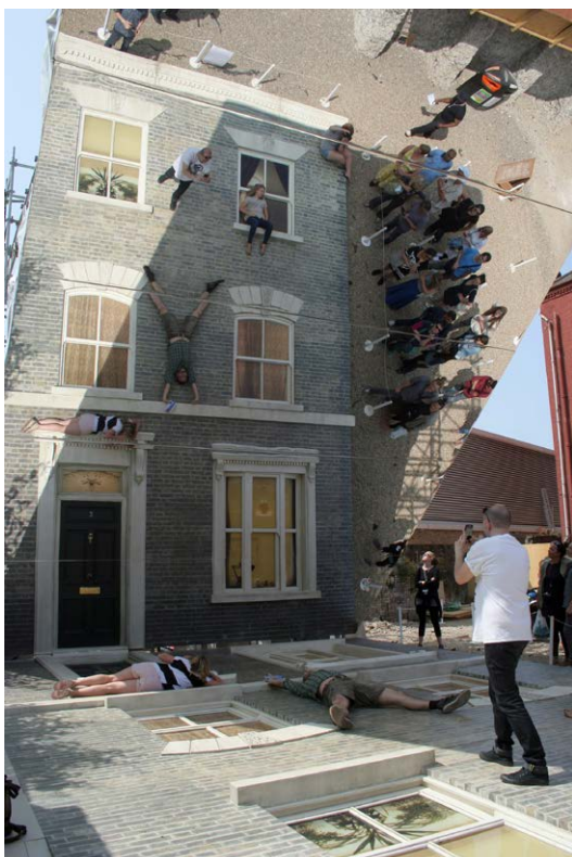
Dalston House, Londres

Algunos de los proyectos de mayor calado, instalados en museos y centros de arte, tienen la característica de haber sido realizados teniendo en cuenta el contexto en el que iban a ser exhibidos, por lo que podríamos considerarlos dentro de la categoría conocida como "site specific".