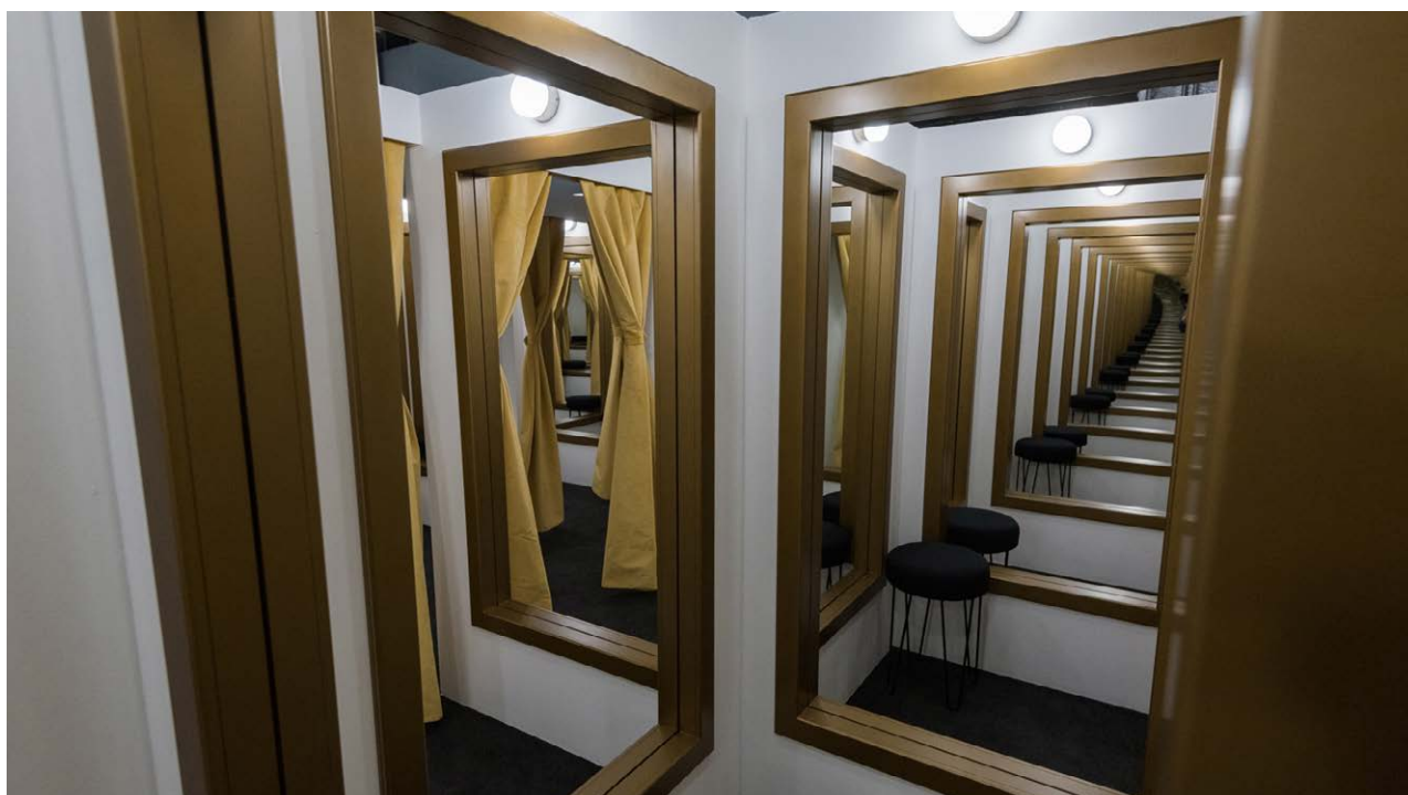
Detalle y perspectiva infinita de Changing Rooms

La cuestión lúdica y participativa, la interacción con el espacio y los objetos que lo componen, así como la presencia de otros espectadores, son los elementos fundamentales para acceder a los diferentes niveles de interpretación de la obra.