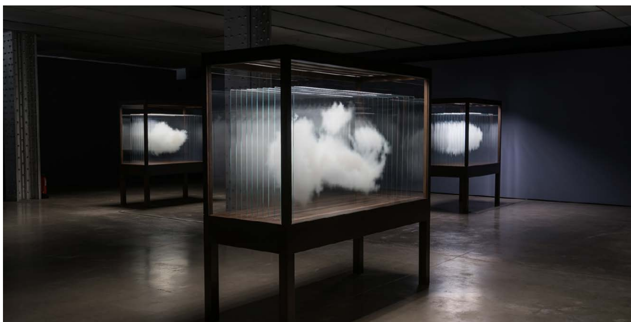
Nido de las nubes en el Espacio Fundación Telefónica

La cuestión lúdica y participativa, la interacción con el espacio y los objetos que lo componen, así como la presencia de otros espectadores, son los elementos fundamentales para acceder a los diferentes niveles de interpretación de la obra.