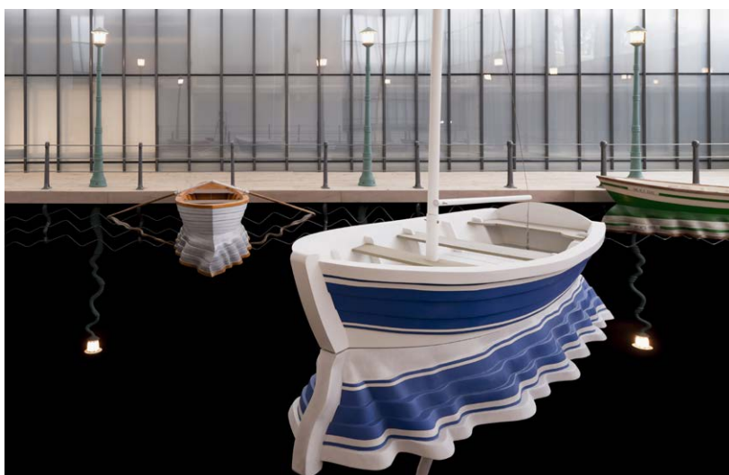
Port of Reflections, 2014, National Museum of Modern Art, Seoul ©

En 2014 expuso por primera vez la que ha sido considerada como una de sus obras principales en este tipo de producción, titulada, Port of Reflections . En ella el artista se sirve de nuevos juegos visuales para crear una escenografía. En este caso, el espacio es un puerto, pero en lugar de espejos, el reflejo de los elementos que lo conforman se esculpe en el vacío,