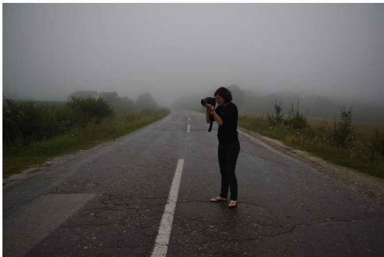
Olivia Arthur (Reino Unido, 1981)

Tras obtener su grado en Matemáticas por la University of Oxford, Olivia Arthur estudió fotoperiodismo en el London College of Printing en 2003. Ese mismo año, se mudó a Delhi para trabajar como fotógrafa freelance . Durante su estancia en Italia en 2006, empezó a trabajar en el proyecto The Middle Distance , un trabajo sobre la vida de las jóvenes que transcurre en la frontera entre Europa y Asia y que se ha exhibido en el Centre Pompidou de París, en la Triennale de Milán, el Art Museum en Shanghái y en el Shiodomeitalia Creative Center de Tokio.