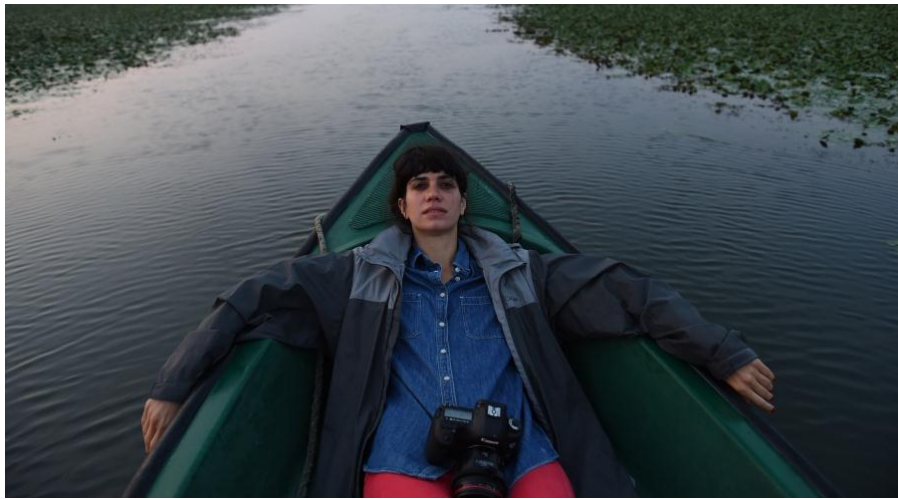
Jessica Dimmock (EEUU, 1978)

Graduada por el ICP de Nueva York, ha recibido numerosos premios, entre los que se incluyen el Premio Infinity de Fotoperiodismo (2014), el Premio Inge Morath de la Magnum Foundation (2008), una Mención especial del Santa Fe Center of Photography (2007) y una beca de investigación Marty Forscher del Photo District News (2007). En 2007 publicó su primer libro, The Ninth Floor , un proyecto fotográfico que le llevó a vivir durante tres años con heroinómanos que ocupaban un edificio de lujo en la 5a avenida de Manhattan. Su trabajo se ha expuesto en el Centre Pompidou (París), en el FOAM (Ámsterdam), el International Photography Center (Milán), en el Kunsthaus de Dresden y en las Naciones Unidas (Nueva York). En 2011 fue nombrada miembro de pleno derecho de la agencia VII Photo. Su trabajo se ha publicado en numerosos medios de comunicación, entre los que se incluyen: Aperture , W , The New Yorker , the New York Times Magazine , The Sunday Times , The British Journal of Photography , Time , Grazia y Photoicon , así como en las obras A New American Photographic Dream , C International y American Photography 22 .