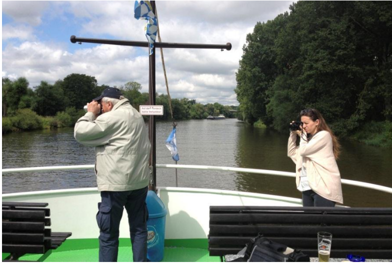
Lurdes R. Basolí (España, 1981)

La fotógrafa Lurdes R. Basolí es graduada en Comunicación Audiovisual y posee un posgrado en fotoperiodismo por la Universidad Autónoma de Barcelona. Vive y trabaja entre Barcelona y San Sebastián. Desde 2005, Basolí ha trabajado para grandes medios de comunicación españoles y de presencia internacional, como La Vanguardia Magazine , El País Semanal , El Magazine de El Mundo , Interviú , Maxim , GQ , Glamour , The Sunday Times Magazine , Foto8 , Internazionale , La Nación y El Universal .