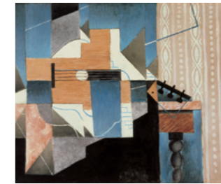
Juan Gris La guitare sur la table, 1913

Perhaps unexpectedly—and this is something that has often been overlooked until now— Juan Gris and Cubism were instrumental in the transformation of Latin American modern art. Indeed, from a variety of perspectives and approaches, both the exhibition and the collection highlight the implicit or explicit connections between Juan Gris and Emilio Pettoruti, Xul Solar, Rafael Barradas, Joaquín Torres-García and Vicente do Rego Monteiro. They subsequently expand their