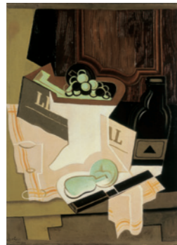
Juan Gris Nature morte devant l'armoire, 1920