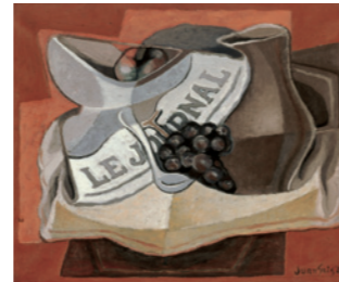
Juan Gris La grappe de raisins, 1925

Cubism is regarded as the cornerstone of modernity in the visual arts. It is usually identified almost exclusively with the contributions of Picasso and Braque over a short period of time, contributions which played an extraordinarily valuable and decisive role in shaping the plasticconsciousness of our time. However, this canonical Cubism was accompanied by another Cubism—or rather, by other Cubisms —whose contributions were equally valuable in that they spread the flow of modernity through Europe and America.