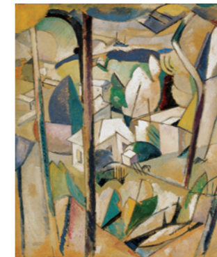
Albert Gleizes Paysage des Bermudes, 1917

The exhibition, like Telefónica's Cubist Collection, revolves around the work of Juan Gris. The artist is presented in all the diversity and complexity of his career, of his work with systems of proportions and diverse textures following his invention of plastic rhymes . Juan Gris is also the leading exponent of the new form of Cubism that emerged between 1916 and 1923, which Vicente Huidobro, Albert Gleizes, Jean Metzinger, André Lhote and María Blanchard all helped to shape.